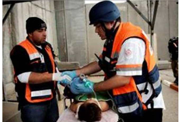
Durante Plomo Fundido, Israel levantó una clínica para los palestinos en el cruce de Erez

Tras años de contención, y a pesar del interés israelí por mantener la calma, los ataques con miles de misiles y morteros disparados desde la Franja de Gaza provocaron la reacción del Tzahal en la Operación Plomo Fundido (diciembre 2008 a enero 2009). Dicha operación militar pretendía evitar las actividades terroristas, reducir el disparo de los misiles contra civiles israelíes tanto como mejorar el entorno de seguridad para los residentes del sur de Israel. Durante la operación militar, una importante actividad de ayuda humanitaria para los palestinos de Gaza continuó llegando, a pesar de los costos operativos (militares) de permitir la entrega de dichos bienes.