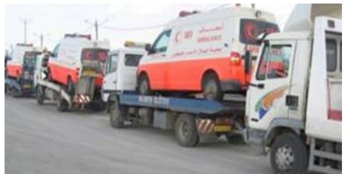
Ambulancias entrando a Gaza en el 2009

Durante la operación militar, se estableció una clínica médica en el Cruce de Erez. Israel también implementó un período de cese de fuego, durante tres horas, con el fin de permitir que los ciudadanos locales se muevan libremente. Durante estos lapsos de calma, el Hamás disparó más de 40 proyectiles de mortero.