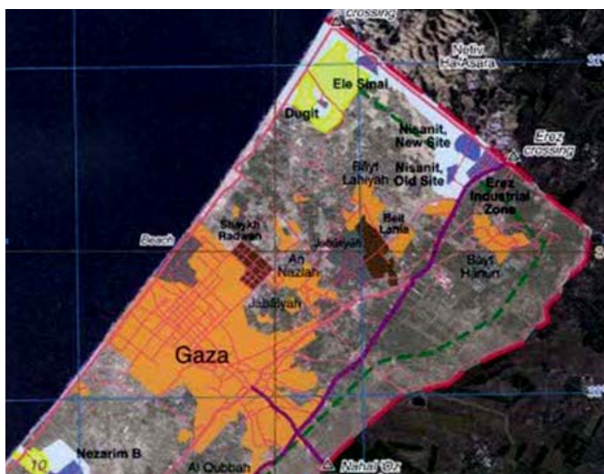
Gaza desde el paso fronterizo de Erez a la ciudad de Gaza

(Desde el paso fronterizo de Erez a la ciudad de Gaza)