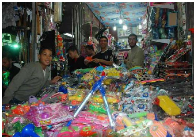
Imágenes como ésta, de los mercados en la Franja de Gaza, son una constante: no sólo no hay escasez si no que se puede hallar casi todo...

En los últimos dos capítulos hemos establecido que el sitio a Gaza, por parte de Israel, es una "falsedad" que está siendo utilizada por el Hamás para mantener a la opinión pública mundial en su postura pro palestina y para mantener el estado de constante pobreza que le ayuda a mantener su poder y la dependencia de las poblaciones civiles en las estructuras del movimiento terrorista. Siendo así, ¿cuál es la razón por la que una flotilla de barcos pro palestinos quiere llegar a Israel a; supuestamente; romper el bloqueo que no existe?